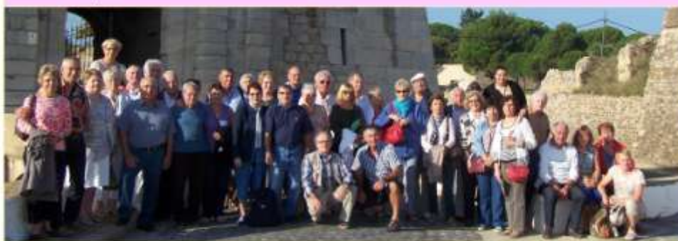
L'ensemble des médaillés prêt à en découdre avec cette forteresse.