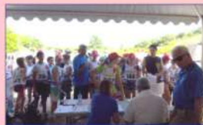
Départ de la course d'orientation pour les équipes de Benjamins et Minimes