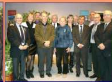
Le Comité Directeur et les récipiendaires.