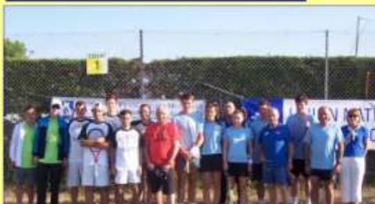
Nos médaillés en poste à Toulouges se sont mêlés avec les équipes avant le début des rencontres.