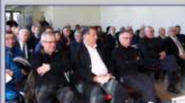
Les Présidents et Vice-présidents des Comités de l'Aude, de l'Hérault et de la Lozère

La décision est approuvée à la majorité.