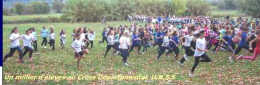
Un millier d'élèves au Cross Départemental U.N.S.S

Lac de Saint Jean Pla de Corts (26 novembre 2014)