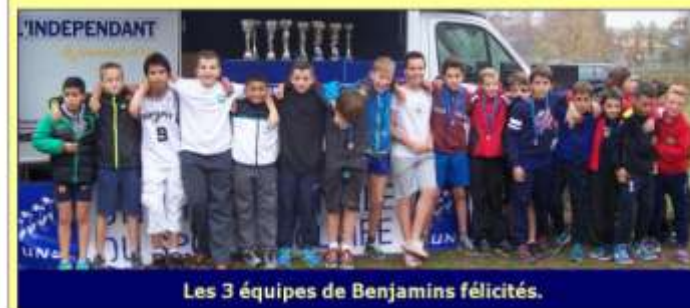
Les 3 équipes de Benjamins félicités.