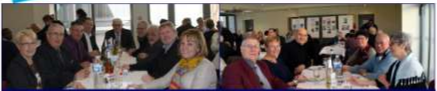
Des instants post-Assemblée générale. Instants appréciés par les médaillés ; des moments partagés en toute convivialité.