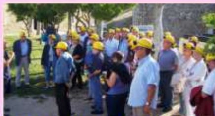
Avant de visiter place aux dernières consignes

Après cette présentation, nous sommes dotés de casques et de lumières frontales et nous sommes répartis par groupe de 12 personnes pour être « chargés » sur des 4x4 à la sécurité inexistante. Sommes-nous dans le tournage d'un film d'aventures? Non, ce n'est que du réel. Les 4x4 s'engagent dans un sentier caillouteux, pentu et nous promènent dans la grande fosse. Première halte : tout le monde doit descendre et mettre sous tension les belles lanternes frontales. Et pour cause, nous sommes invités à déambuler dans les contre-mines souterraines./.