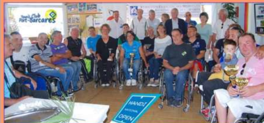
Les Champions récompensés de l'Open de France 2015