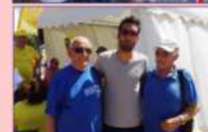
2 médaillés, José et Isidore Entourent le Champion du monde de Biathlon Martin FOURCADE qui a passé la journée avec les collégiens.