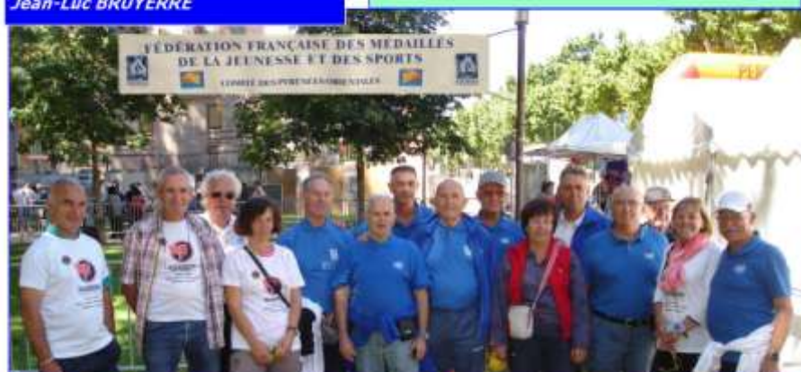
Une partie des médaillés qui ont contribué à la réussite de la PERPINYANE 2015

Pour la seconde année, 6 médaillés du Comité 66 ont répondu présent aux sollicitations du Lion Club de Perpignan pour animer le stand, inscrire les personnes et les aiguiller vers les spécialistes de la vue.