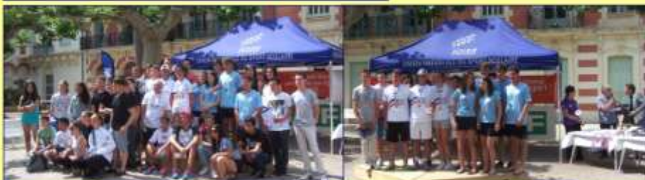
Les Titres de Champions de France 2015 ont été décernés.