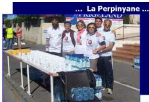
... La Perpinyane ... Les Ravitailleurs au 5°km