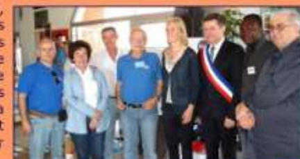
Les médaillés des P.O autour de Mme la Ministre Ségolène NEUVILLE.