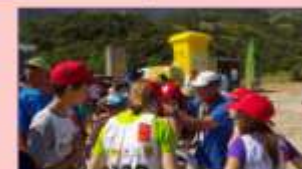
Petit rappel des consignes avant de prendre le départ.