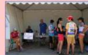
Réponse aux questions d'intérêt patrimonial.